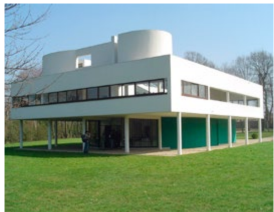
Oben: Villa Savoye erbaut von Le Corbusier 1928 Links: Architekturmodell