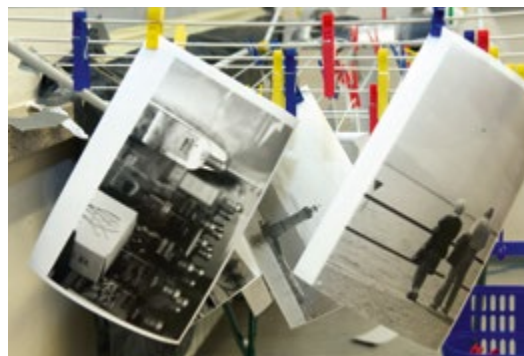
Bildentwicklung im Fotolabor