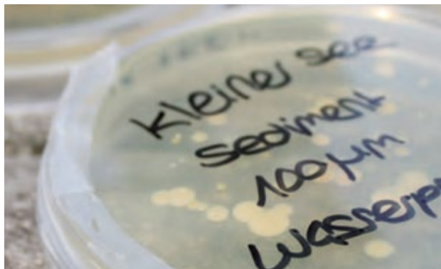
Oben: Kieselalge; Unten: Sedimentprobe

des Bodensees und der Analyse und Bestimmung der darin über die Jahrhunderte hinweg konservierten Pollen und Fragmente von Organismen wollen wir dieser Entwicklung auf den Grund gehen. Anschließend verarbeiten wir diese Fragmente zu Dauerpräparaten weiter. Die in Kunstharz eingebetteten Präparate kann jeder Teilnehmende am Ende des Kurses mit nach Hause nehmen.