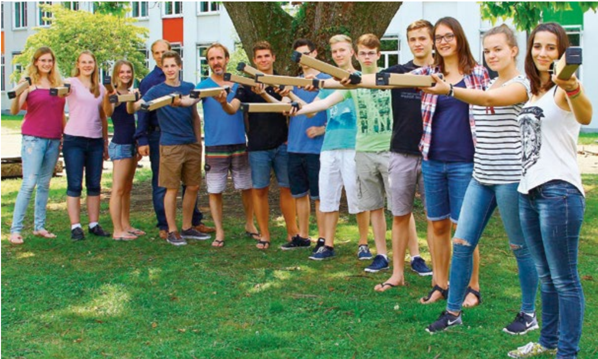
Kursteilnehmende 2015 mit selbstgebauten Spektrometern

Noch vor weniger als 60 Jahren sprach Theodore Maiman – der Erfinder des Rubinlasers – von seiner Erfindung als einer »Lösung, die ein Problem« suche. Heutzutage hat sich das Bild von Grund auf gewandelt, ja, geradezu in sein Gegenteil verkehrt: Aus Alltag und Forschung, aus Telekommunikation und biochemischer Industrie ist die seinerzeit scheinbar nutzlose Technologie kaum noch wegzudenken. Der Laser steht dabei exemplarisch für die allgemein zunehmende Bedeutung optischer und photonischer Technologien. Eine regelrechte „optische Revolution« zeichnet sich ab, von ähnlicher Tragweite wie die Nutzbarmachung des elektrischen Stromes im 20. Jahrhundert.