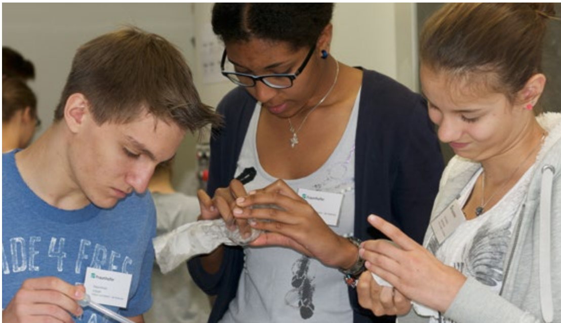
Vorbereitungen zum Mikroskopieren

Wir wollen im wörtlichen wie im übertragenen Sinn unter die Oberfläche schauen, um die Welten, die sich im Wasser verbergen, zu sehen. Wir entwickeln Experimente, mit denen wir dem Wasser Antworten auf unsere Fragen finden: »Was lebt in einem Wassertropfen?«, »Welche Chemikalien sind im Bodensee?«, »Wie hat sich der See verändert?« Dabei werden wir verschiedene wissenschaftliche Methoden kennenlernen und zusammen ausprobieren.