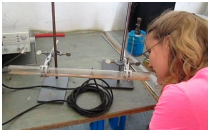
Stehende Schallwellen werden im Kundtschen Staubrohr sichtbar gemacht.