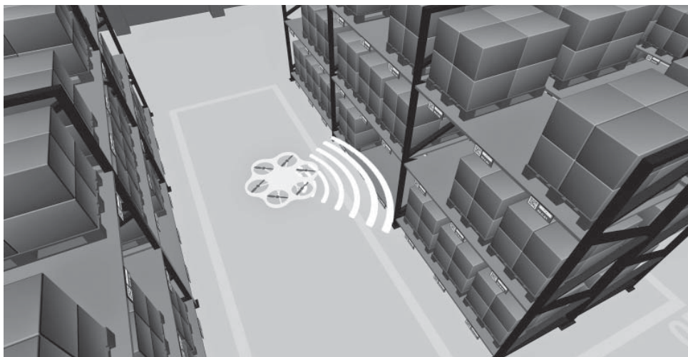
Der autonome Flugroboter soll künftig in der Lage sein, eigenständig zu navigieren und Inventuren durchzuführen. (© Fraunhofer IML) | Bild in Farbe und Druckqualität: www.fraunhofer.de/presse

Aktuelle Lösungen können automatisch erhobene Inventurdaten nicht ohne zusätzliche Softwareentwicklung in bestehende Lagerverwaltungssysteme integrieren. Die InventAIRy-Forscher arbeiten hingegen an smarten Schnittstellen, welche die Informationen nahtlos in bestehende Systeme übermitteln. Damit sparen Handelsbetriebe viel Zeit und Geld – auch Dokumentationsfehler gehen zurück. Hinzu kommt, dass die Flugroboter Lagerbestände kontinuierlich überwachen könnten. »Auf diese Weise wäre es in der Produktion möglich, Materialengpässe frühzeitig zu erkennen und zu beseitigen, noch bevor es zu Ausfällen kommt«, so Projektleiter Freund. Die Zwischenergebnisse des Teams sind vielversprechend. »Bereits Mitte 2015 wollen wir einen teilautomatischen Flug starten. Bei diesem verharret der mit Identifikationstechnologie ausgestattete Roboter – ohne dass er über eine Fernbedienung gesteuert wird – an einer Position und verhindert Kollisionen mit Hindernissen wie etwa Regalen«, erklärt der Projektleiter.