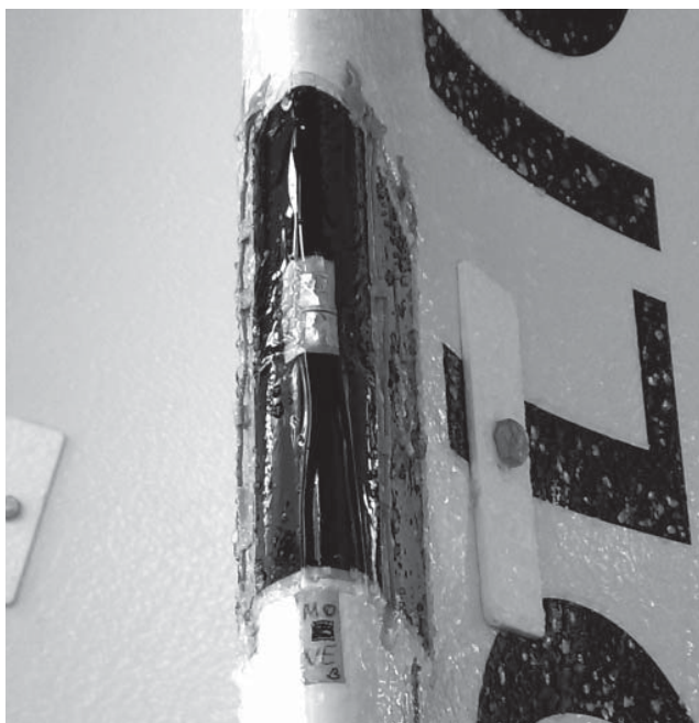
Das per CNT-Schicht beheizte Areal des Rotorblatts bleibt eisfrei. (© Fraunhofer IPA) | Bild in Farbe und Druckqualität: www.fraunhofer.de/presse