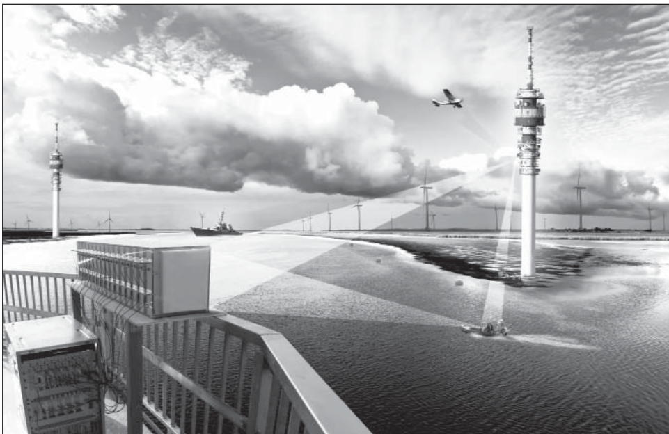
Das Antennensystem erkennt fahrende Boote auch anhand ihrer Bewegung.

Die Technologie eignet sich nicht nur für die Terrorabwehr. Derzeit arbeiten die Forscher an einer Variante für Windräder. Hohe Windmasten müssen nachts mit Blinklichtern befeuert werden, damit Hubschrauber- und Flugzeugpiloten gewarnt sind. Das Blinken aber stört viele Menschen. Windräder sollen daher mit Flugzeugdetektoren ausgestattet werden, die die Lichter nur dann einschalten, wenn sich ein Flugzeug nähert. Zwar gibt es bereits Detektoren, die auf die Funksignale von Flugzeugen ansprechen. »Aber für den Fall, dass diese ausfallen, brauchen wir ein redundantes System – und dafür eignet sich die PCL-Technik sehr gut«, sagt Zemhari.