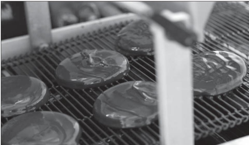
Auf einem Laufband werden die Taler mit Schokoladenüberzug durch den Kühlkanal bewegt. (© Fraunhofer IVV) | Bild in Farbe und Druckqualität: www.fraunhofer.de/presse

Hersteller können ihre Schokoladen von den Lebensmittelexperten des IVV im Labor untersuchen lassen. Hierfür müssen sie die flüssige Masse während der Produktion aus dem Tank entnehmen. Die Forscher sind in der Lage, die Qualität der Schokoladen zu beurteilen, den Anteil des Füllungsfetts festzustellen und zu analysieren, wie hoch die Gefahr ist, dass Fetteis entsteht. Sie beraten die Unternehmen, mit welchen Maßnahmen sich die Produktionsprozesse optimieren lassen. Je nach Anwendungsfall kann man durch ein Anpassen der Temperiermaschine, des Kühlkanals oder des Rückflusses gegensteuern. Mit der Bewertung der Back- und Füllungsfette können außerdem Rezepturen verbessert werden.