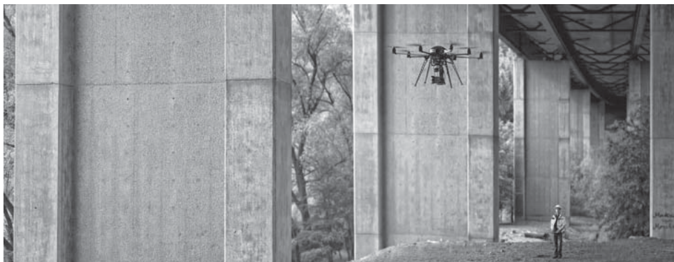
Der Hightech-Miniflieger scannt Bauwerke in wenigen Stunden ab. (© Uwe Bellhäuser) | Bild in Farbe und Druckqualität: www.fraunhofer.de/presse

»Sachverständige und eine handnahe Prüfung können durch unser Mikroflugzeug nicht ersetzt werden. Der Oktokopter beschleunigt aber das Prüfverfahren und ermöglicht ein permanentes Monitoring und eine Dokumentation von Anfang an. Ausführungsmängel und Gewährleistungsansprüche lassen sich frühzeitig erkennen, erforderliche Maßnahmen zur Instandsetzung rechtzeitig einleiten. Das heißt mehr Sicherheit für Gebäude und Menschen«, resümiert Eschmann.