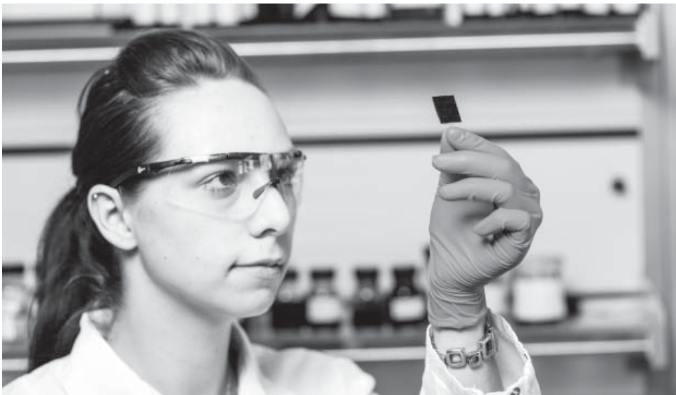
Die Forscherin zeigt eine am Fraunhofer IPA entwickelte Graphen-Elektrode für den Einsatz in Superkondensatoren. (© Fraunhofer IPA) | Bild in Farbe und Druckqualität: www.fraunhofer.de/presse

Um die neue Technologie präsentieren zu können, hat das Projektkonsortium einen Demonstrator des Energiespeichers entwickelt. Er ist im Autospiegel angebracht und sorgt für die richtige Einstellung desselben. Das energieautarke System wird über eine Solarzelle geladen. Der Demonstrator wurde erstmals Ende Mai auf einem Workshop am IPA vorgestellt.