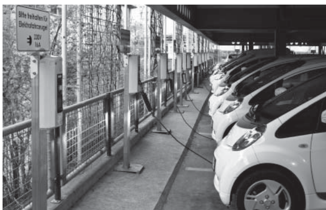
30 Elektroautos können im Parkhaus am Fraunhofer Institutszentrum in Stuttgart zeitgleich Strom zapfen. (© Victor S. Brigola/Fraunhofer IAO) | Bild in Farbe und Druckqualität: www.fraunhofer.de/presse

Im nächsten Schritt wollen die IAO-Forscher mit ihrem »lebendigen Labor« eine Testumgebung für Industriebetriebe, Systemanbieter, Stadtwerke, Kommunen und Verteilnetzbetreiber schaffen und das Potenzial der kleinen unabhängigen Netze ausloten: Im Innovationsnetzwerk Micro Smart Grid sollen in den kommenden zwei Jahren Interessierte die Möglichkeit erhalten, neuartige Konfigurationen und Betriebsstrategien zu erarbeiten. Am Fraunhofer Demonstrator können die Projektpartner ihre Hard- und Softwarekomponenten testen oder untersuchen, wie sich das Netz mit anderen Verbrauchern verbinden lässt, etwa um die Klimaanlage eines Gebäudes zu betreiben oder weitere Produktionsanlagen zu integrieren. »Langfristiges Ziel ist es, einzelne, lokale Energienetze zu einem großen Smart Grid zusammenzuführen«, so Rose. Ein virtuelles Modell ihres intelligenten Stromnetzes präsentieren die Forscher vom 7. bis 11. April auf der Hannover Messe am Fraunhofer-Gemeinschaftsstand in Halle 2, Stand D18.