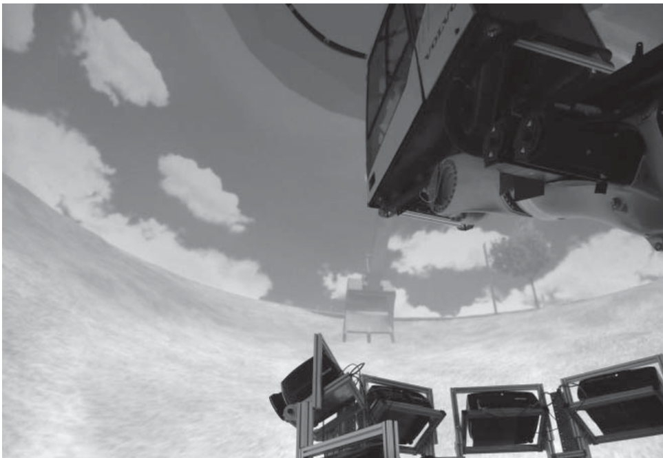
Der Fahrzeugsimulator des Fraunhofer-Instituts für Techno- und Wirtschaftsmathematik ITWM hat 18 Kameras, die ihre Bilder auf eine riesige Kuppel projizieren. Die Fahrerkabine kann nahezu jede Fahrsituation simulieren. (© Fraunhofer ITWM) | Bild in Farbe und Druckqualität: www.fraunhofer.de/presse

Die Simulationsanlage am ITWM ist bereits in Betrieb – derzeit laufen dort zwei Projekte in Zusammenarbeit mit der Volvo Construction Equipment. Die Forscher zeigen die Technologie vom 7. bis 11. April auf der Hannover Messe am Fraunhofer-Gemeinschaftsstand Digital Factory (Halle 7, Stand B10).