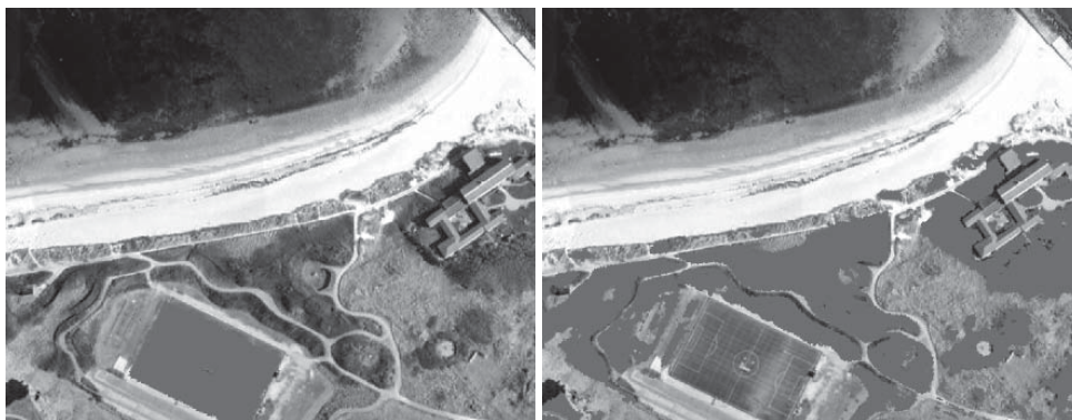
Kunstrasen (links) oder Vegetation (rechts)?: Der Spectralfinder erkennt Oberflächen an deren Farbspektrum – in Echtzeit. (© Fraunhofer IOSB) | Bild in Farbe und Druckqualität: www.fraunhofer.de/presse

Besucher des CeBIT-Gemeinschaftsstands der Fraunhofer-Gesellschaft können den SpectralFinder testen: Sie können die Kamera vor einer Materialwand bewegen, deren Liveaufnahmen auf dem Monitor ansehen und die Software anwenden. Sie haben die Möglichkeit, Gegenstände aus der Welt des Bergbaus zu untersuchen ebenso wie Dinge, die beim Umweltmonitoring eine Rolle spielen. Die Wissenschaftler bieten ihre Technologie auch in einem virtuellen Labor an. Ein erstes Szenario ist ebenfalls auf der CeBIT zu sehen.