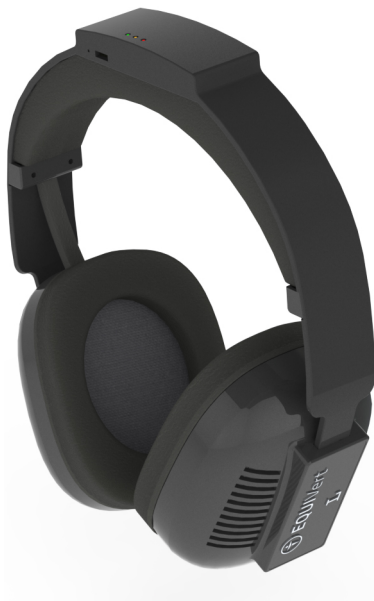
EQUIFit – Patientengerät