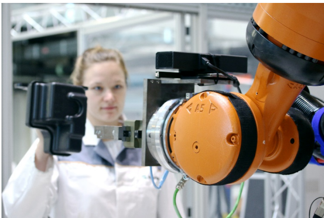
Abb. 1 Der Roboter erkennt das Bauteil, das die Mitarbeiterin hält und folgt behutsam ihrer Hand bis zur Übergabe des Werkstücks.

Die Algorithmen sind einsatzbereit. Auf der Preview der Hannover Messe am 24. Januar 2019 stellen die Forscherinnen und Forscher des Fraunhofer IWU ihre Entwicklung vor. Auf der Hannover Messe vom 1. bis 5. April 2019 präsentieren sie den Besucherinnen und Besuchern eine Demo-Applikation, die sich interaktiv durch Gesten steuern lässt (Halle17, Stand C24).