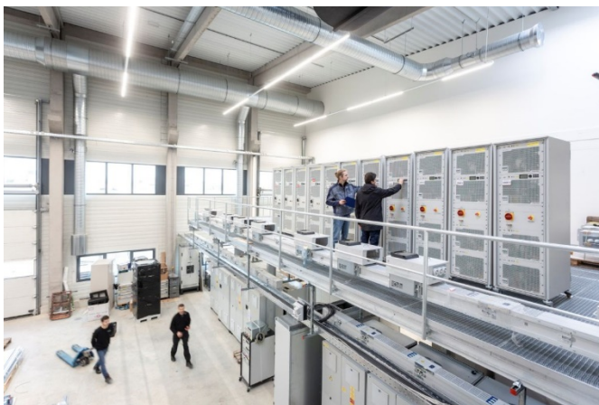
Abb. 1 Das Multi-Megawatt Lab am Fraunhofer ISE in Freiburg ermöglicht die hochgenaue Charakterisierung der elektrischen Eigenschaften von Wechselrichtern bis zu einer Leistung von 10 MW.