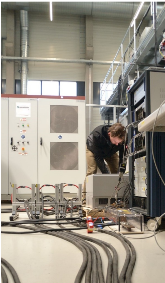
Abb. 3 Für den messtechnischen Nachweis der netzbildenden Eigenschaften von Wechselrichtern wurde das Stromnetz im Labormaßstab nachgestellt.

FORSCHUNG KOMPAKT 1. Dezember 2021 || Seite 4 | 4