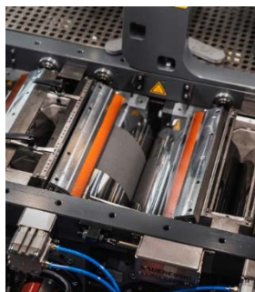
Abb. 2 Auf der schneller rotierenden Walze bildet sich ein feiner Beschichtungsfilm.