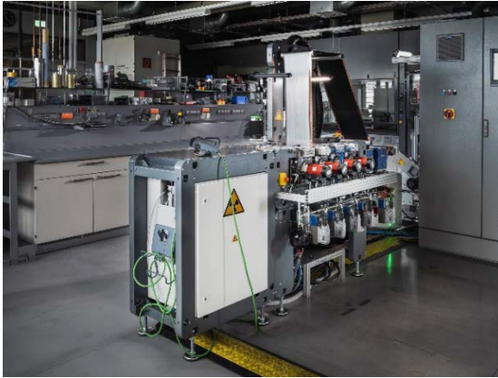
Abb. 3 DRYtraec®-Anlagen benötigen keine langen Trocknungsstrecken und nehmen daher deutlich weniger Platz ein als herkömmliche Anlagen zur Herstellung von Batterieelektroden.