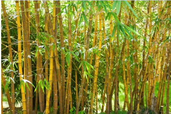
Abb. 1 Ideal für den Einsatz im Gebäudebau: Bambus ist ein hochwertiger Ersatzstoff für Holz und lässt sich auch ganz ähnlich verarbeiten.