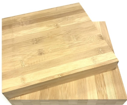
Abb. 3 Bambus lässt sich ähnlich wie Holz zu stabilen Platten verarbeiten.