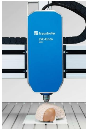
Abb. 1 Das Laser-Scanning-Mikroskop des Projekts LSC-Onco ist durch den Einsatz von MEMS-Technik so klein und kompakt, dass es auch im Operationssaal direkt an der Patientin oder am Patienten eingesetzt werden kann.