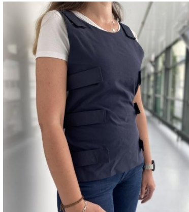
Abb. 1 In der Vorder- und Rückseite der Textilweste sind Akustiksensoren integriert, die den Thorax abhören.