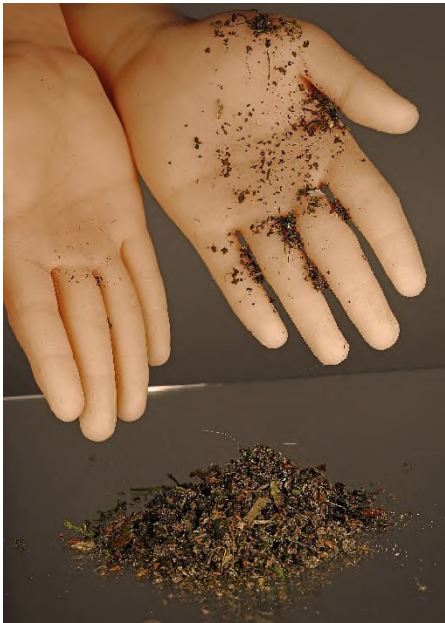
Abb. 2 Die vakuumultraviolette Modifizierung von Silikonoberflächen ist ein möglicher Ersatz zur Gasphasen-Fluorierung. Die schmutzabweisende und verschleißresistente Funktionsschicht erlaubt vielfältige Anwendungen in der Medizintechnik von haptisch angepassten Prothesen bis hin zu schmutzabweisenden Beatmungsmasken. Die behandelte Silikonhand (li.) demonstriert die Vermeidung der Anhaftung von Schmutzpartikeln an deren Oberfläche.