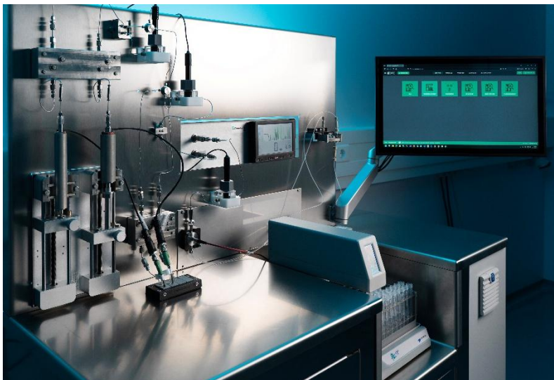
Abb. 1: Screening-Anlage zur automatisierten und digital gesteuerten Herstellung von mRNA-Wirkstoffen. Die Qualitätskontrolle ist im Bioprozess integriert.