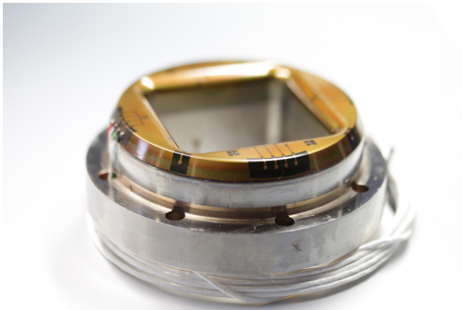
Tiefziehwerkzeug mit multi- sensorischem Dünnschicht- system.